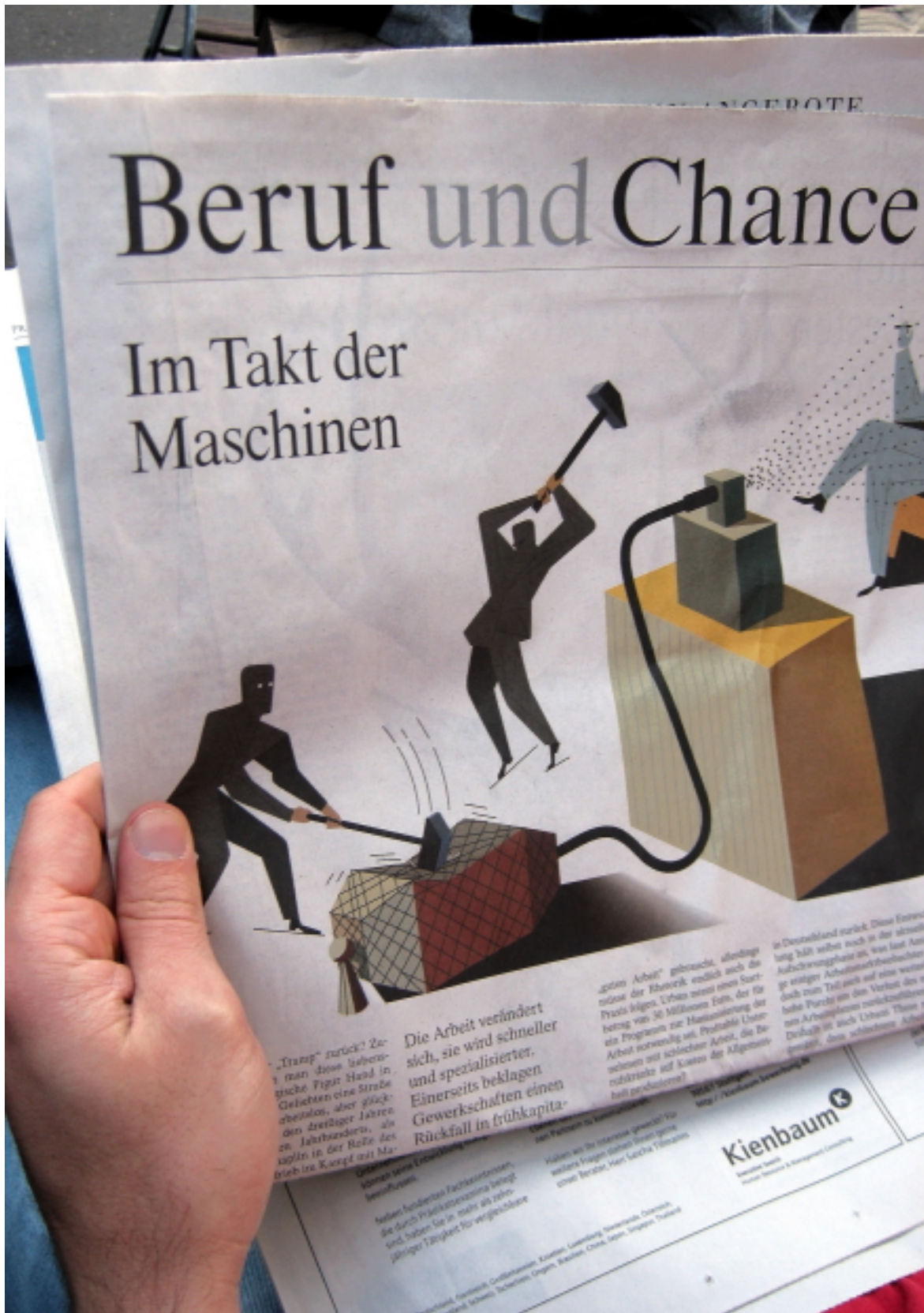
Die Suche nach dem Rattenrennen im FAZ-Stellenmarkt: „Die Arbeit verändert sich, sie wird schneller und spezialisierter. Einerseits beklagen die Gewerkschaften einen Rückfall in frühkapitalistische Zeiten....“

Das ganze funktioniert so: Um gemeinsame ökonomische Interessen zu verfolgen, bilden sich um Bezugspunkte (Cluster) Leistungsträger der verschiedenen Art, die das gleiche Ziel verfolgen. Gerald Geppert analysiert im Buch das Prinzip der Cluster beim Global-Player Volkswagen AG sehr genau. Einstweilen mag das „Automotiv-Cluster Rhein-Main-Neckar“ als erklärendes Beispiel dafür stehen. Es besteht - so die Selbstdarstellung - aus starken